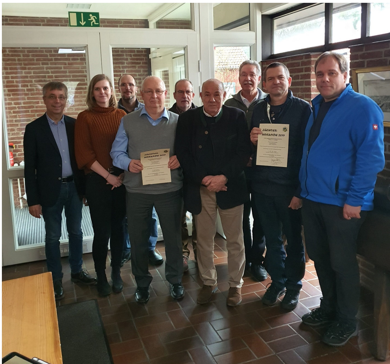
Züchtertagung im LAVES-Institut für Bienenkunde Celle im Februar 2020

Weiter wurden die Ergebnisse der Zuchtarbeit, der Zuchtwertschätzung und die Zuchtplanungen 2020 diskutiert.