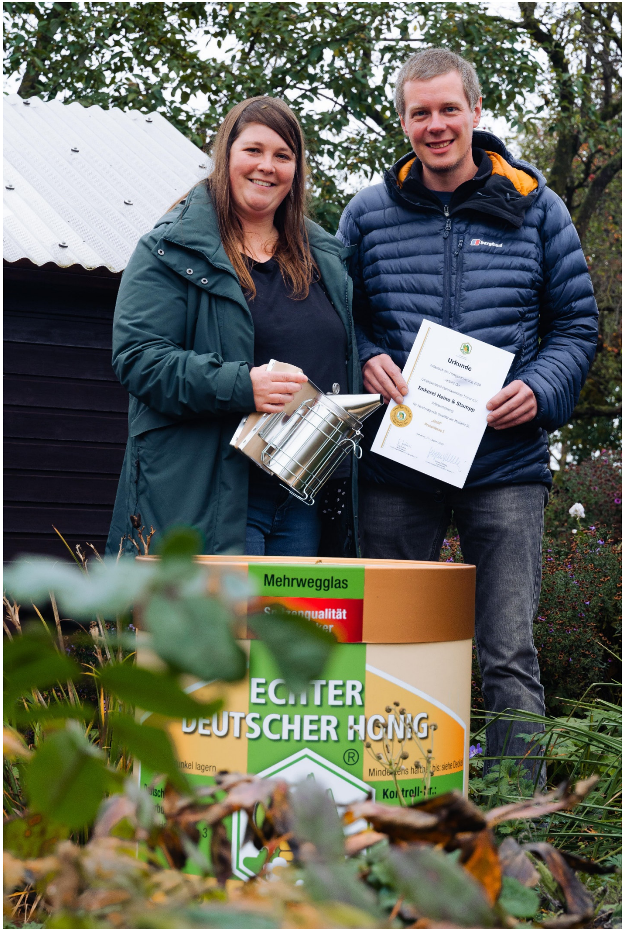
Die Gewinner der Honigprämierung 2020