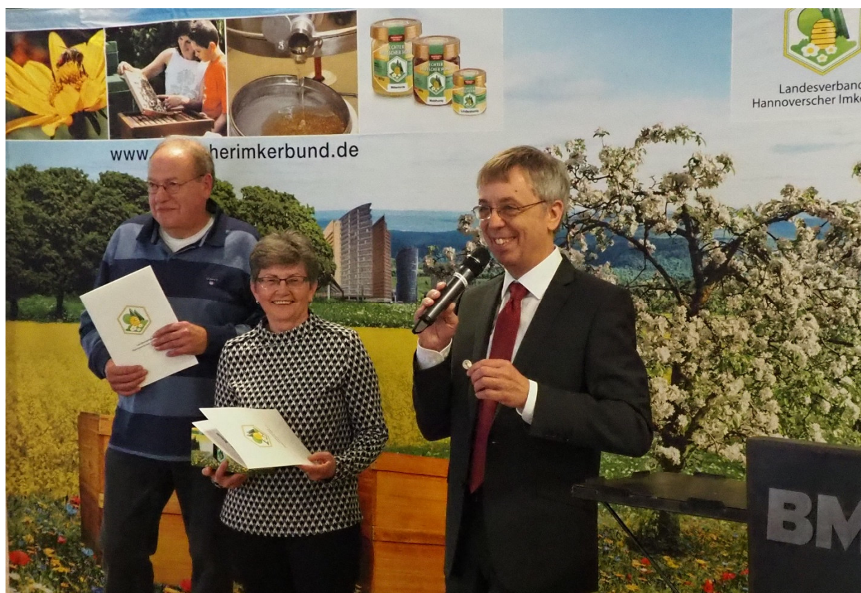
Ehrungen auf der Vertreterversammlung in Braunschweig 2020

Der Jahresabschluss und der Prüfungsbericht des Steuerberaters sind Bestandteil dieses Jahresberichtes.