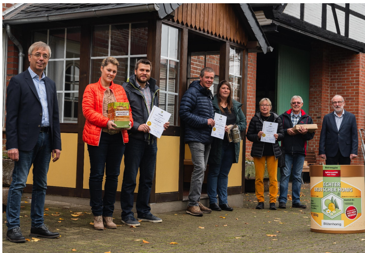
Die Gewinner der Honigprämierung im Oktober 2020