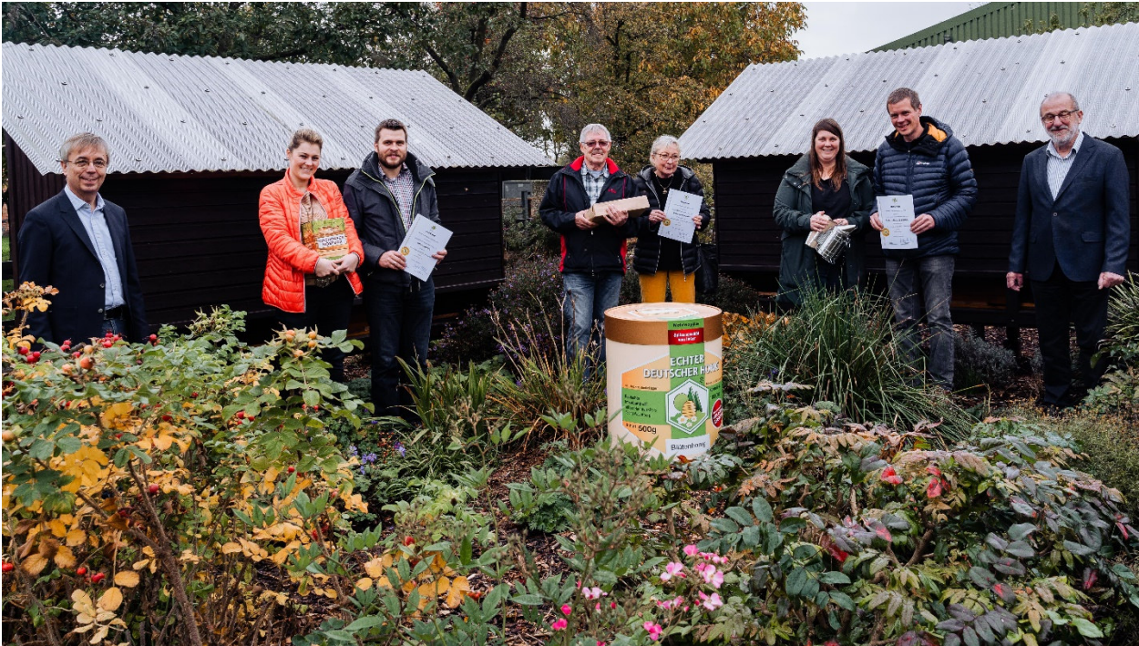
Honigrämierung im Oktober 2020