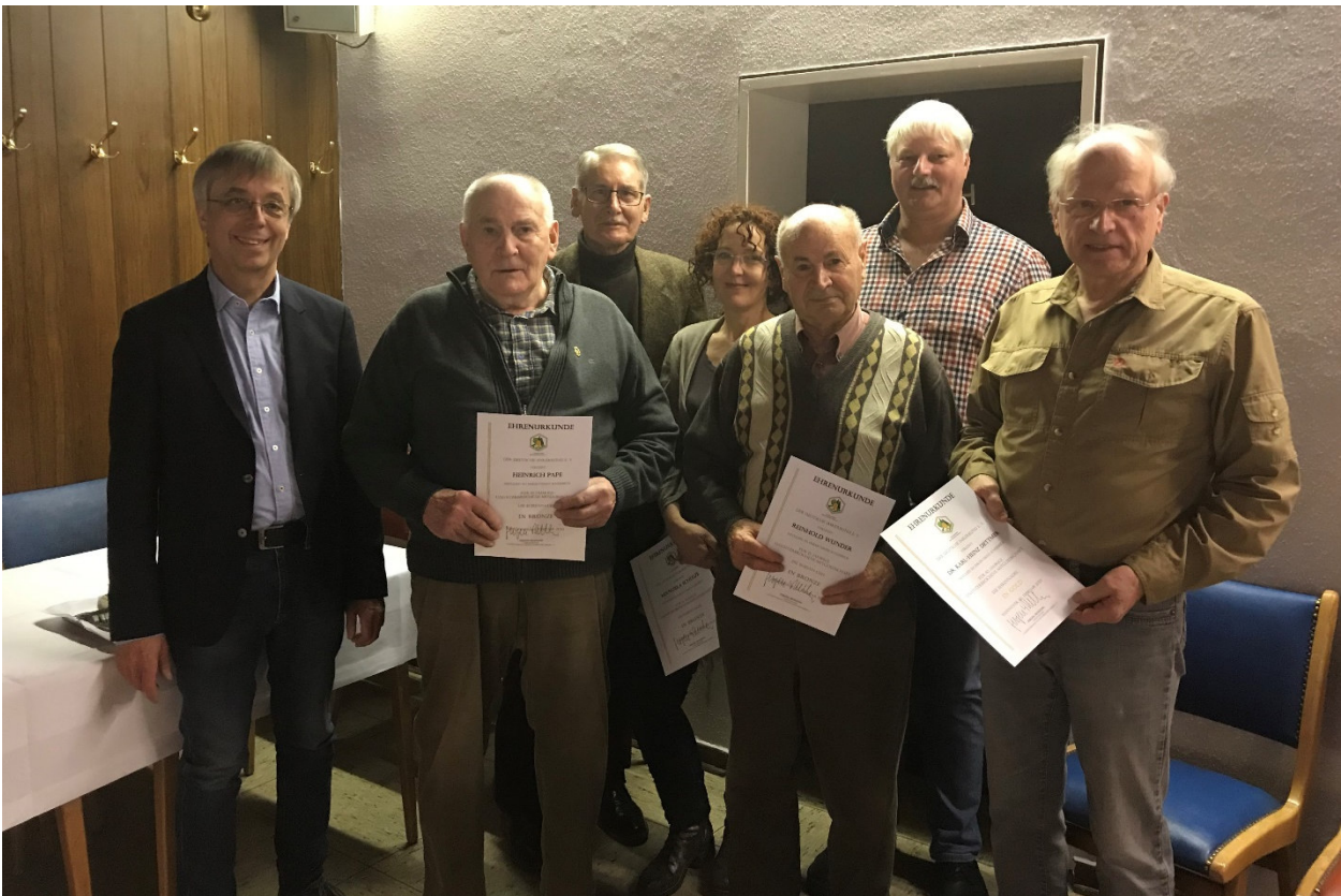
Foto (LV): IV Knesebeck: Verleihung der Ehrennadeln an langjährige Mitglieder anlässlich der Jahreshauptversammlung