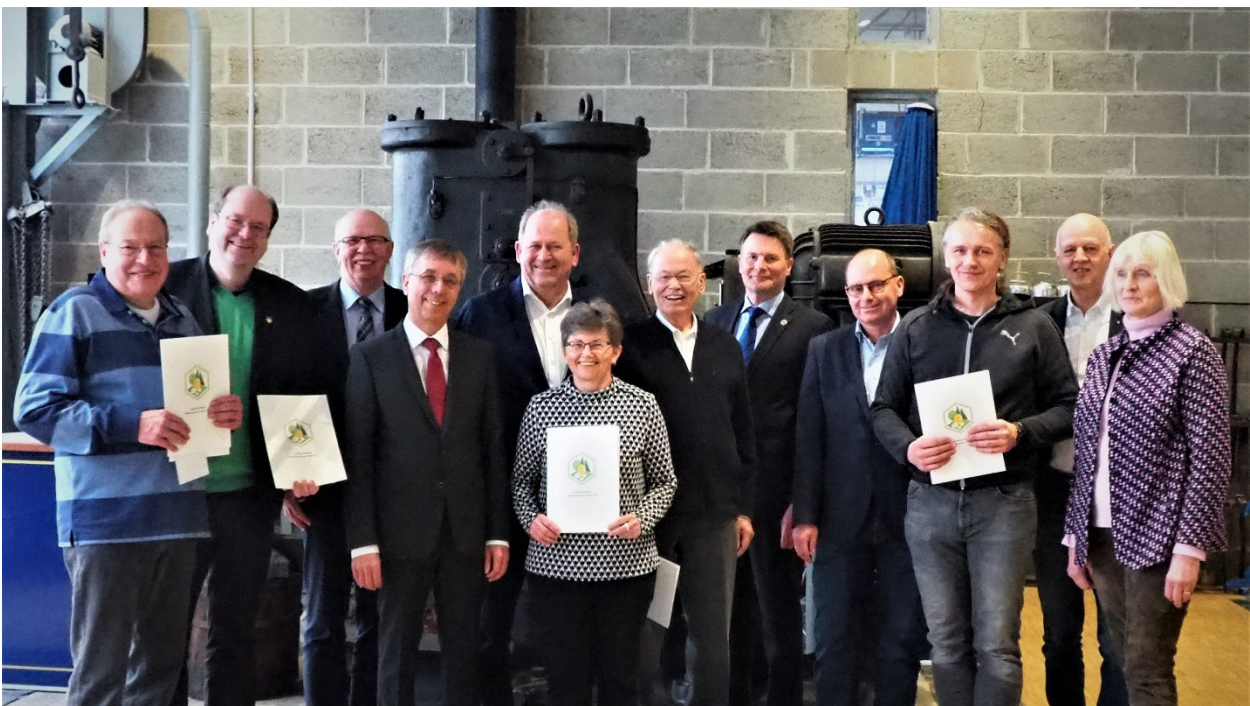
Vertreterversammlung im Februar 2020 in Braunschweig – Vorstand, Ehrengäste und Geehrte